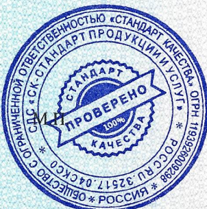
Схема сертификации 1